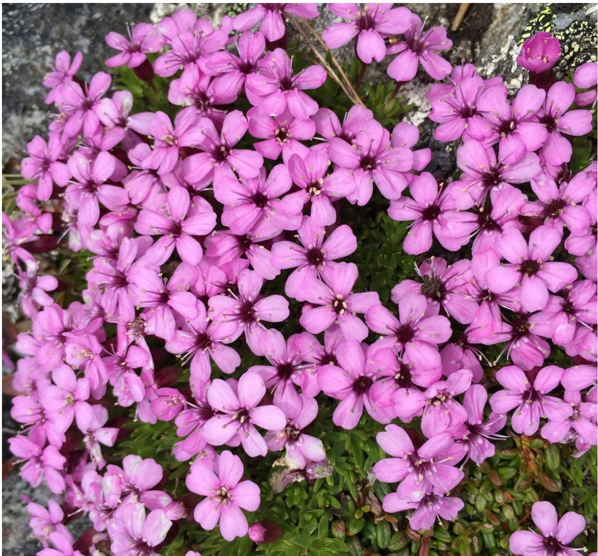
Fjellsmelle, kommuneblome til Nord-Fron

Avsender /returadresse: Landbrukskontoret for Nord-Fron, Strandgt. 54 2640 Vinstra