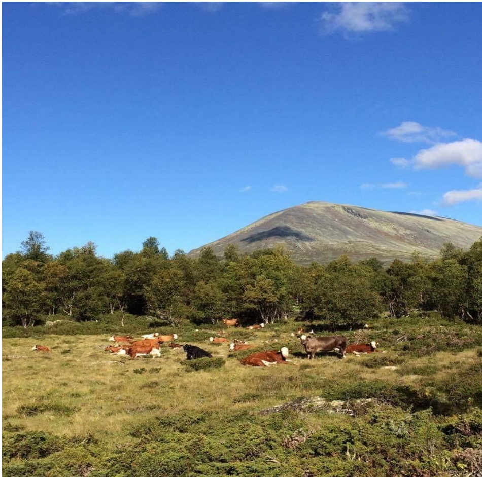
Kyr på beite