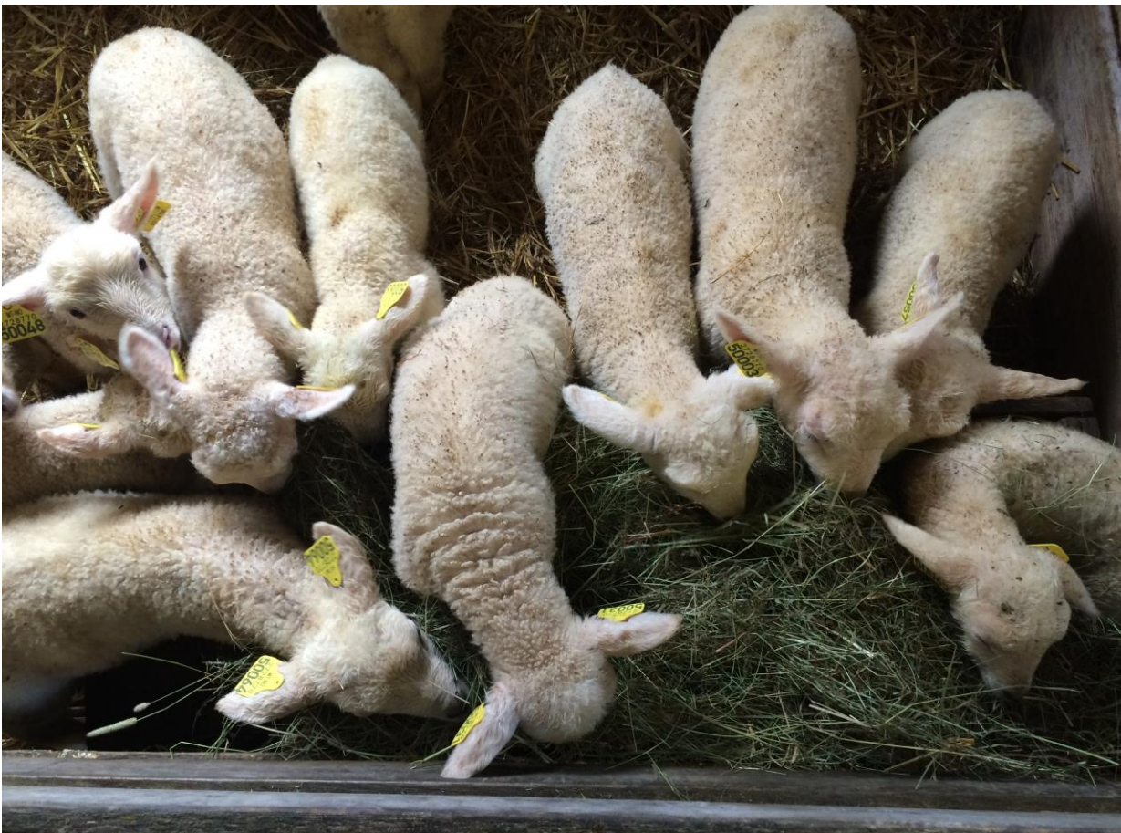
Liv i fjaset

Biosirk skal ta hjerneprøver av døde storfe og småfe fra 1. mars 2019. Bor du i Finnmark eller et område som Norsk Protein ikke kjører må du varsle Mattilsynet som før. Alle selvdøde eller avlivede storfe over 4 år* og sau/geit over 18 måneder skal tas hjerneprøve av.