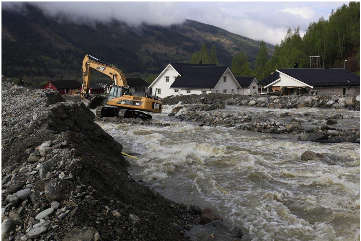
Flaum i Storåa i 2013. Bildet er teke to dagar etter flaumtoppen.

Endeleg vedteke av Kommunestyret 19.6.2018 i KOM-sak 57/18.