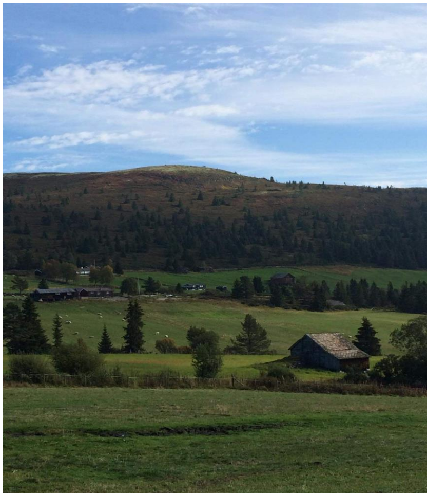
Lauvåsen på Sødorpfjellet